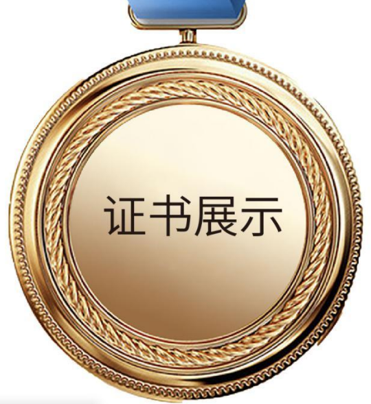
美国国家认可委认可

Visit www.anab.org for a list of IAFB programs recognizing ANAB accreditation.