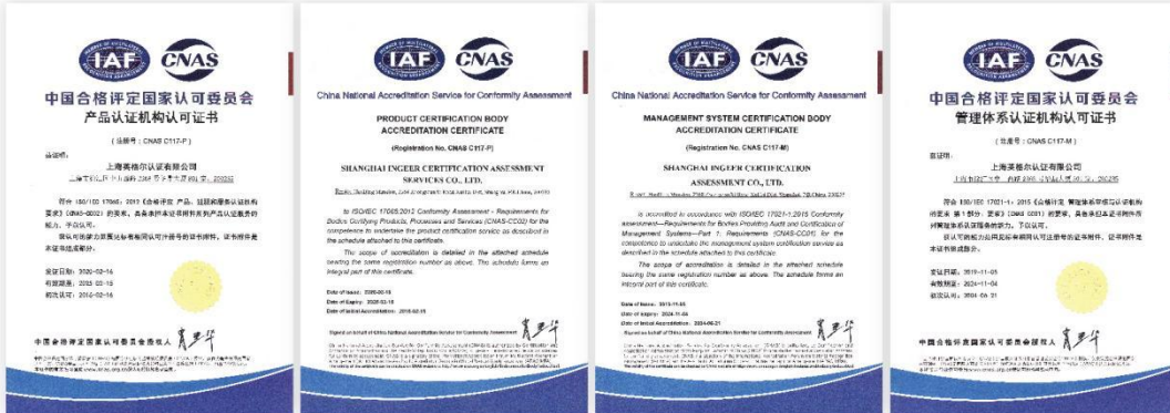
中国认可委认可证书